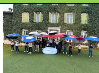
Photo groupe du 12/04