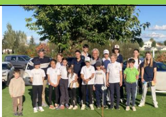
Photo groupe du 07/12