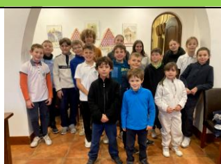
Photo groupe du 08/02